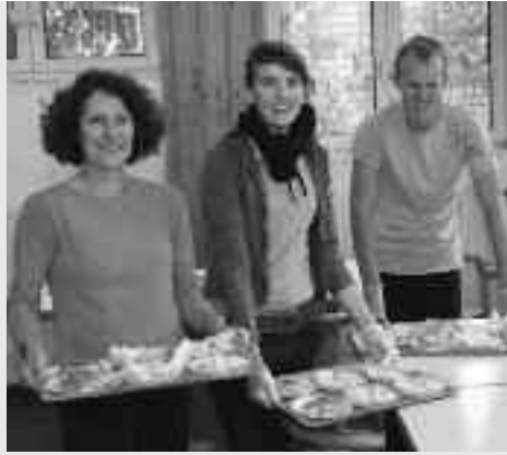
Ehrenamtliche mit Tablett voll selbstgemachtem Nachtisch.