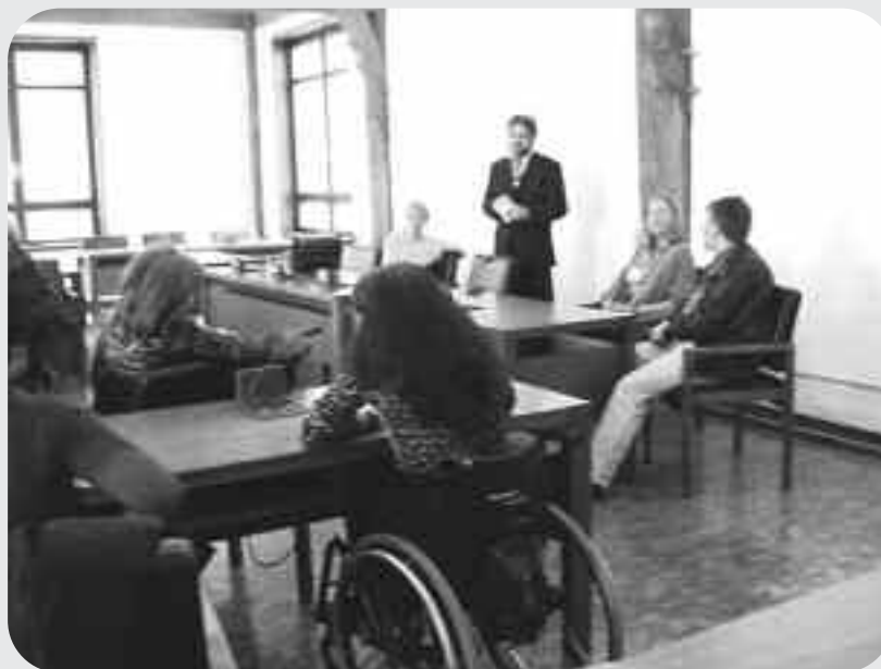
Ein Blick ins Fotoalbum der Anfangszeit des heutigen FORUM & Fachstelle INKLUSION: Aufnahme einer Besprechung mit dem damaligen Ersten Tübinger Bürgermeister Gerd Weimer (stehend in der Mitte des Bildes) im Großen Sitzungssaal des Tübinger Rathauses.

Seitdem im Dezember 2014 das Landes-Behindertengleichstellungsgesetz Baden-Württemberg in Kraft getreten ist, können Kreise und Städte Behindertenbeiräte gründen. Nicht definiert ist, wer bestimmt, ernannt oder gewählt wird, wer bestimmen kann oder wer wählen darf oder wer gewählt werden darf. Das Koordinationstreffen der Tübinger Behindertengruppen - jetzt FORUM & Fachstelle INKLUSION ist nun seit 30 Jahren eine zuverlässige Begleitung für die Stadt Tübingen sowie ihre behinderten Bürger*innen mit ihren besonderen Bedürfnissen. Und das ist gut so. <