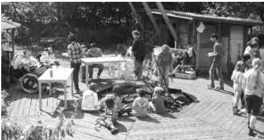
Um „Inklusion in der Offenen Kinder- und Jugendarbeit“ geht es im Modellprojekt des Bundes der Jugendfarmen und Aktivspielplätze e.V.