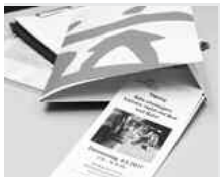
Unterlagen zur MOVE-Tagung.

Eine ausführliche Dokumentation der Tagung gibt es auf www.freundeskreismensch.de , unter Mobilitätsprojekt MOVE